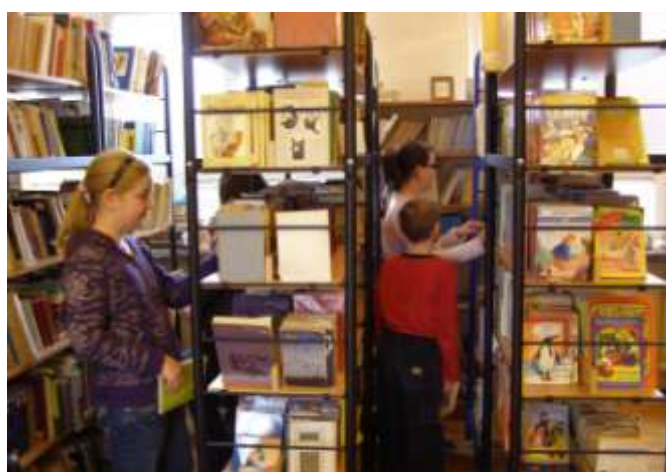
Biblioteka pełna książek

Szkoła Podstawowa nr 2 im Stanisława Konarskiego w Tarnowie, ul. Szewska 7 tel. (014) 655-73-66, fax (014) 655-73-67, e-mail: sekretsp2@umt.tarnow.pl www.konarski.wiara.pl