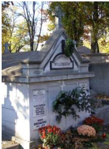
Grobowiec rodziny Holendrów