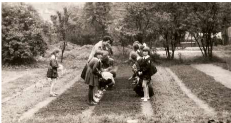
Praca na szkolnej działce