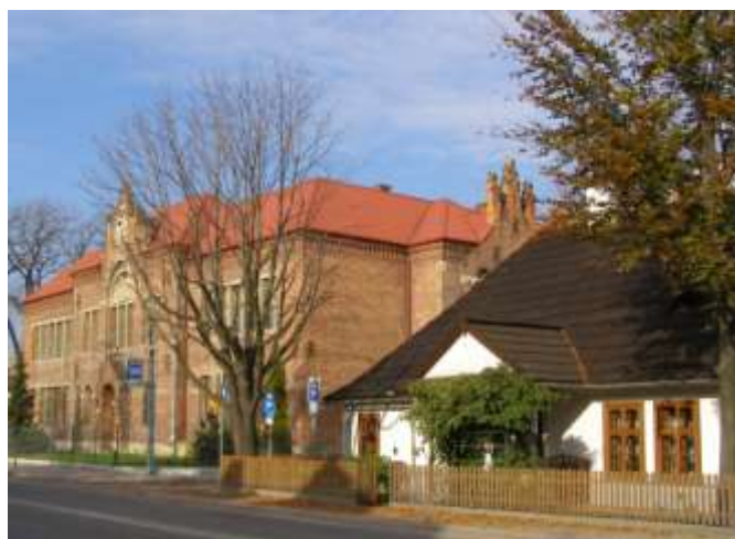
Efektowne otoczenie starego, zabytkowego gmachu