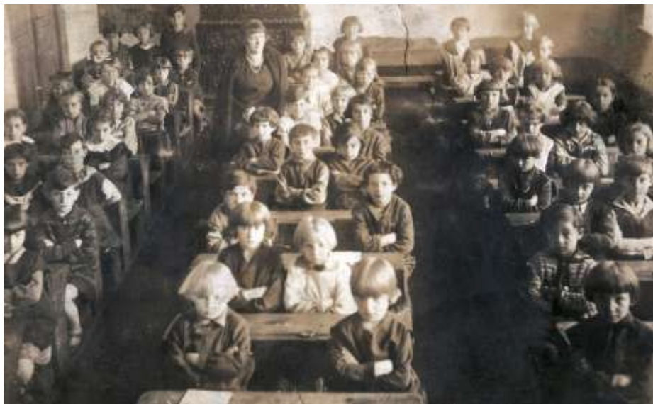
Uczennice Szkoły Żeńskiej im. S. Konarskiego w 1928 roku