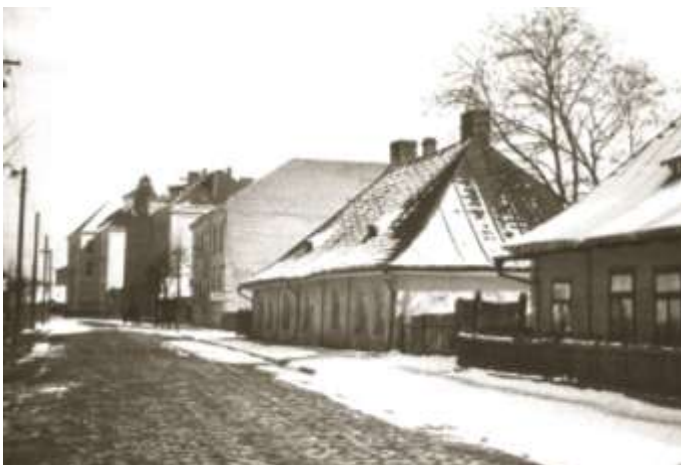
Ulica Konarskiego już wybrukowana, w głębi budynek sądu. Okres międzywojenny.

Na Zabłociu nie było wówczas znaczących budowli użyteczności publicznej. Poruszano się po ulicach