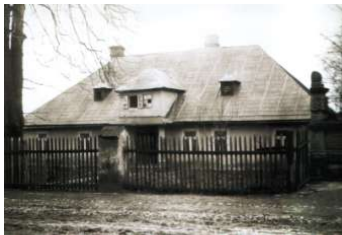
Dworek na rogu ul. Zabłockiej i Szewskiej, ok. 1915 r. Widoczna błotnista nawierzchnia ulicy.

i okręgowego przy ulicy św. Marcina oraz więzienia przy ul. Konarskiego. To ze względu na zmierzających do sądu przedstawicieli palestry oraz licznych petentów, na głównych ulicach dzielnicy położono granitowe nawierzchnie, urządzono chodniki i zamontowano latarnie. Wówczas też uregulowano łózysko i brzegi Wątoku, a liche kładki zastąpiono solidnymi i ozdobnymi