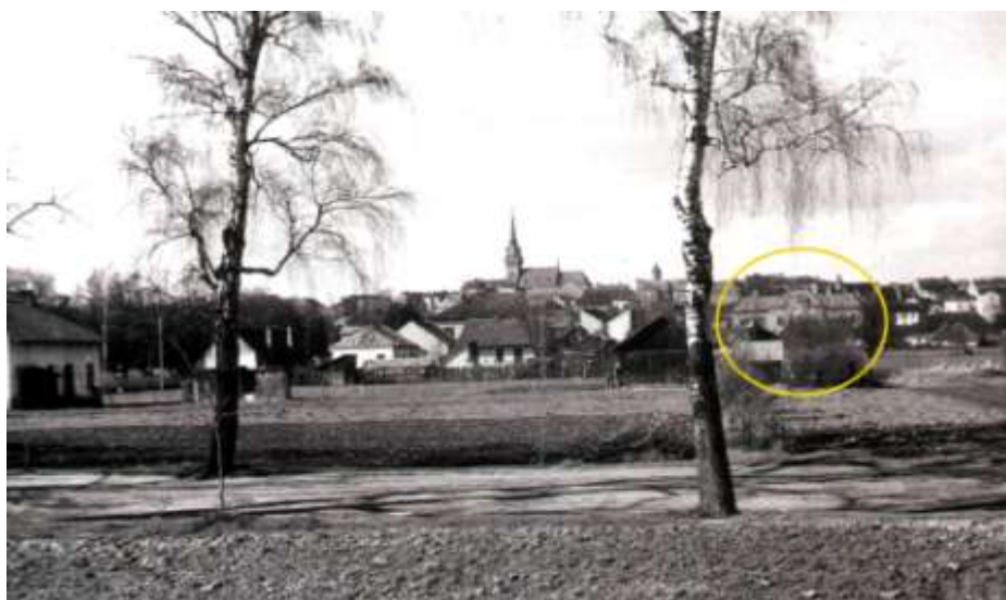
Widok ogólny Tarnowa od strony południowej, rok 1936. Zaznaczony budynek Szkoły im. Konarskiego.