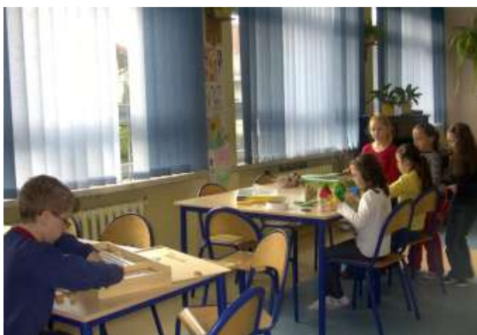
Na nowo urządzona świetlica