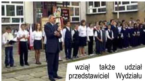
wziął także udział przedstawiciel Wydziału

„Rok szkolny 2005/2006 ogłaszam za rozpoczęty” – takimi słowami Gość dokonał oficjalnego otwarcia nowego roku nauki w tarnowskich szkołach podstawowych. W ceremonii