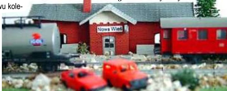
Fragment makiety Kuby

do makiety staram się wykonywać sam, np. węgiel w węglarce zrobiłem z pomalowanych na czarno kamyczków, bele drewna na wagonie z wystruganych patyczków, płotki z zapalek, które potem odpowiednio maluję.