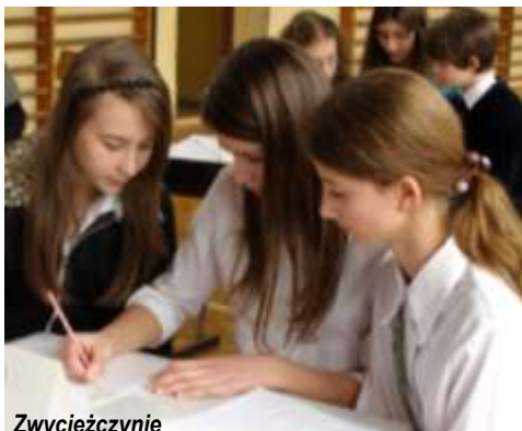
Zwyciężczynie VI Międzyszkolnego Konkursu Literackiego.

z tomu „Przygody Sherlocka Holmesa” A. Conan Doyle’a, „Przygody trzech detektywów – Tajemnica kaszlącego smoka” A. Hitchcocka oraz „Niewiarygodne przygody Marka Piegusa” E. Niziurskiego. Oprócz tego każda drużyna wcześniej wykonywała pracę plastyczną, która w tym roku polegała na zaprojektowaniu oferty reklamowej biura detektywistycznego wybranego bohatera lektury konkursowej.