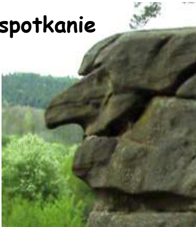
Prawda, jaka sympatyczna?

Następnie niebieskim szlakiem ruszyliśmy zdobywać kolejne skałki. Widzieliśmy m.in. Skałkę z Krzyżem, Grzybek, Piramidy, Borsuka, Warownie, Grunwald, a na